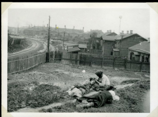
Kharkiv, Ukraine, 1932-33