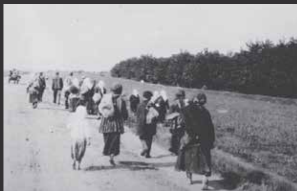
« Fermiers affamés quittant le village pour trouver de l'aide en ville » Printemps-été 1933. Alexander Wienerberger, Album Innitzer.

Nous vous invitons à observer une minute de silence avec nous.